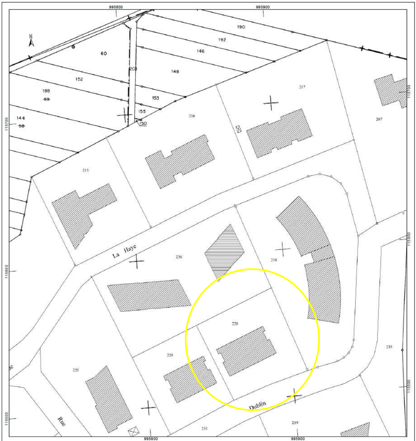
Localisation de la parcelle 60/228 sur le plan cadastral